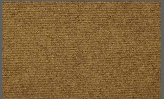
T-05 bej / beige