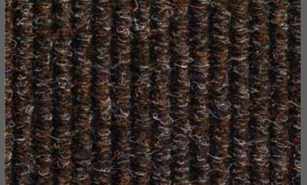
T-60 kahve / brown