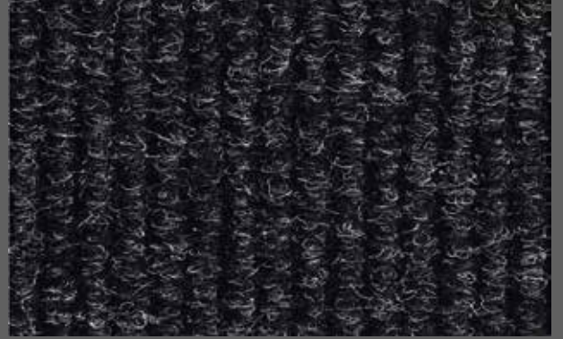
T-50 siyah / black