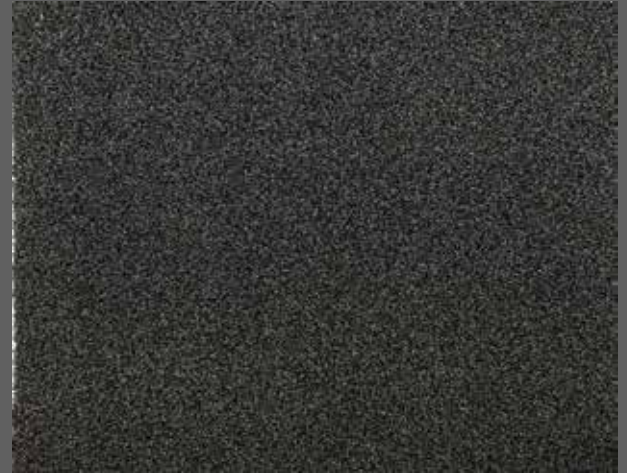
T-05 antrasit/ antracite