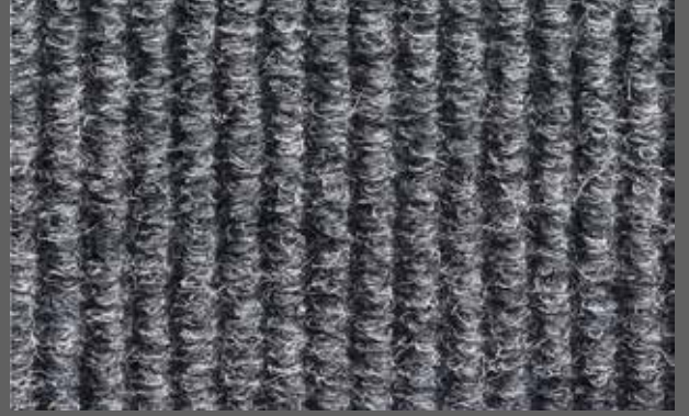
T-16 gri / grey