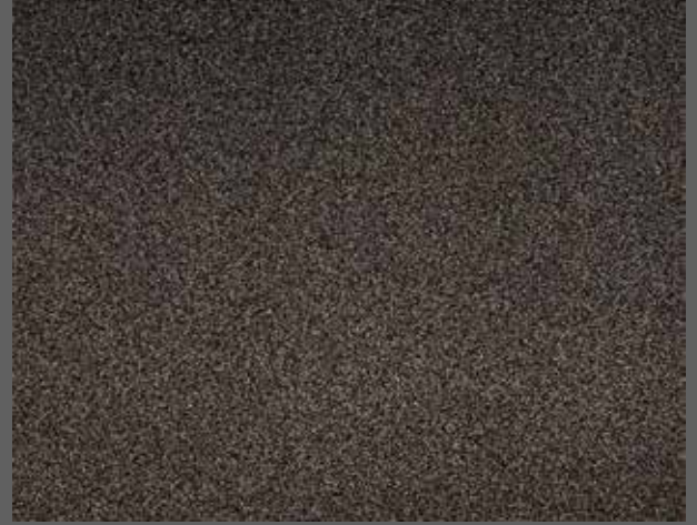
510 kahve / brown