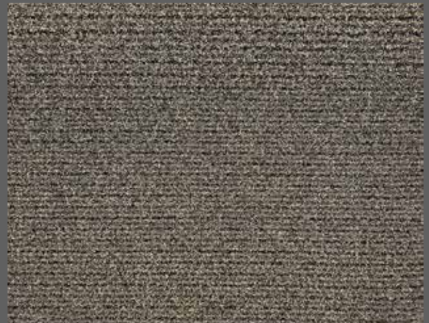
T-05 bej / beige